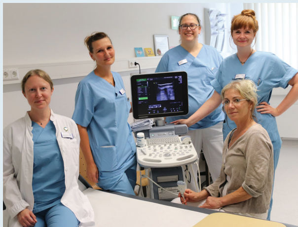
Ein Teil unseres Ärzteteams im Brustzentrum

Neben der Diagnostik und Therapie liegt den Mitarbeitern des Zentrums die seelische, psychologische und soziale Begleitung der Patientinnen am Herzen. Deshalb sind Psychologen, Sozialarbeiter, Physiotherapeuten und eine speziell ausgebildete Brustschwester im Brustzentrum Neubrandenburg tätig. Außerdem arbeiten wir sehr gut mit den Selbsthilfegruppen in Neubrandenburg zusammen.